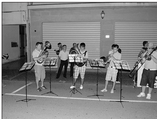
Il Quinta spinta bass quintet