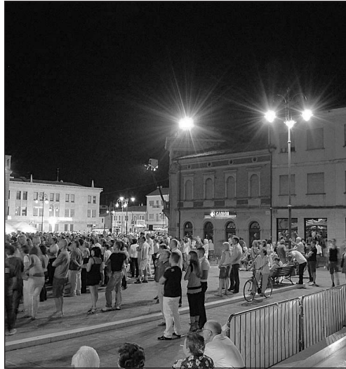
Che successo per la Giovane Notte bianca Nella foto alcuni momenti della kermesse organizzata sabato sera