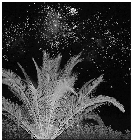
I fuochi d'artificio