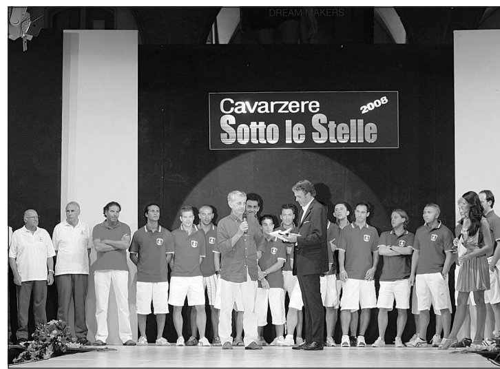
La presentazione dell'Asd calcio Cavarzere