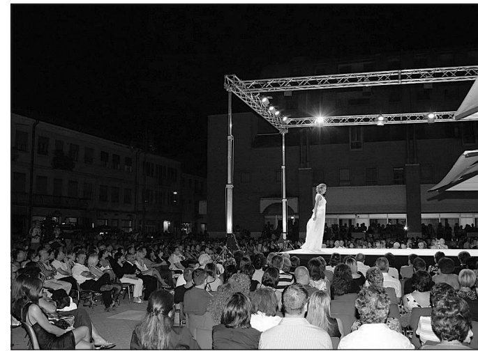
La sfilata vista dal tanto pubblico presente