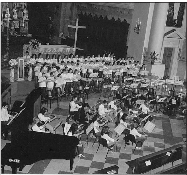
Chiesa di San Giuseppe Domani il saggio di fine anno della Cappon

A quanto emerso dagli accertamenti dei carabinieri, il saldatore avrebbe agito sotto l'effetto del troppo alcool ingerito, prima di dare inizio alla propria scorribanda in centro città.