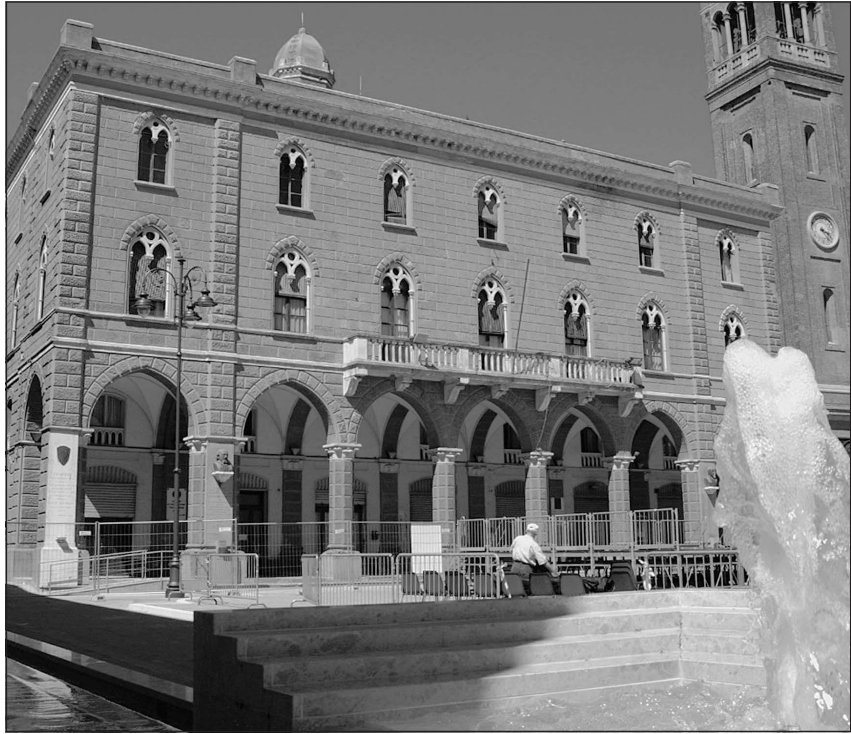
Il centro di Cavarzere e la piazza del municipio ospiteranno il fulcro degli eventi in programma per la Giovane Notte bianca

invece il premio che andrà a miss e mister Acqua & Sapone, offerto dall'omonima catena di negozi presente a Cavarzere. Ma la Giovane Notte bianca non sarà solo questo: le bancarelle invaderanno tutte le vie del centro, ci saranno esposizioni di collezionisti e di artisti locali, gonfiabili per adulti, il raduno di auto tuning, tornei di calcetto e basket, un'anguria e, per il gran finale, pane e nutella offerto a tutti. Sabato 26 è ormai alle porte e, per chi volesse conoscere ancora meglio i protagonisti di questa prima Giovane Notte bianca, può accedere al sito internet www.myspace.com/giovane-nottebianca .