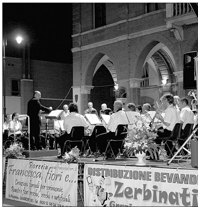
Grande musica in piazza La banda cittadina durante l'esibizione davanti al municipio di Cavarzere. Un giovedì sera davvero particolare nel comune veneziano

Santana prima che Can't take my eyes off you chiudesse il concerto. Grandi applausi e bis concessi al pubblico in una serata all'insegna della buona musica.