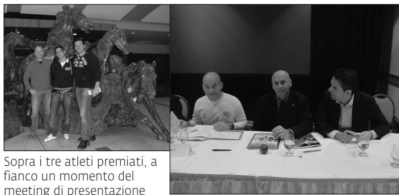
Sopra i tre atleti premiati, a fianco un momento del meeting di presentazione dei prossimi mondiali

Ora, la squadra e il team dell'Eurobody, si prepareranno per l'appuntamento al podio Mondiale del prossimo 31esimo campionato Mondiale di Braccio di ferro, programmato dal 7 al 14 settembre 2009 in Italia, nel nostro territorio, dove il polesine diventerà il punto di riferimento del braccio di ferro dell'intero pianeta. Significativo il passaggio di testimone (la Bandiera Waf) dal