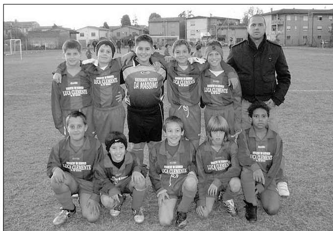
Piccoli campioni crescono Gli Esordienti del Corbola

Emozioni e spettacolo nel derby rosazzurro che chiude la fase autunnale