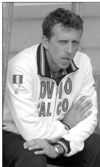
Mister Parlato Il suo Rovigo non ha giocato male, ma servono i punti

Biancazzurri bene solo fino alla tre quarti, poi è mancato il quizzo vincente