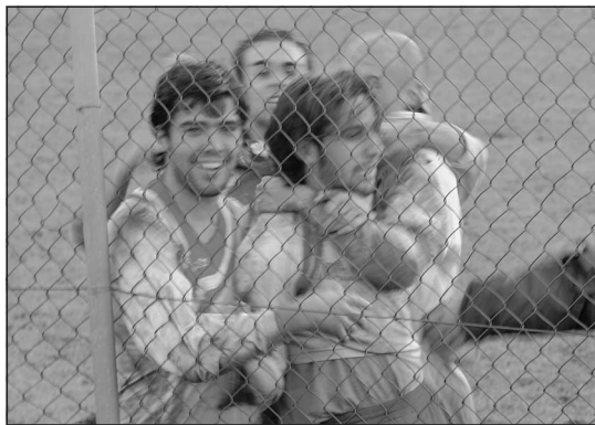
Piva festeggiato dai compagni dopo il gol partita

Con una punizione di poco alta di Graham Bell, al 32', si fa vede-