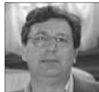
Dalla Tor, Forza Italia

bra che la scelta del sito alternativo sia caduta su San Gaetano, località cavarzerana ai confini con Chioggia, dalla quale ci si collegherebbe con la Romea proprio dalla cittadina clodiense e, all'impianto, ci si arriverebbe dalla strada arginale lungo il canale Gorzone, attraversando le frazioni di Ca' Bianca e Ca' Pasqua o, tra le ipotesi, con una nuova strada. Ma questa decisione prettamente politica, senza l'ausilio di valutazioni tecniche di esperti e senza alcuna concertazione con la popolazione, potrebbe essere la vera "scelta calata dall'alto", che porterebbe avanti un modo di ragionare sorpassato, piuttosto discutibile e privo di ogni fondamento legislativo.