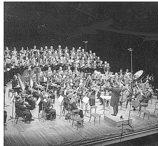
Il coro e l'orchestra Il rinomato Tullio Serafin di Cavarzere

Le faccio infine notare che tra le persone che la sera dell'inaugurazione sono andate a complimentarsi e a stringere la mano alla Signora Kabaiwanska, c'era lo stesso Maestro Banzato, ciò mi fa pensare che anche Lui ha apprezzato la serata al punto da non poter esimersi dall'andare personalmente a congratularsi con l'artista. Io se non approvo la presenza di un artista o come si è esibita non mi scompongo ad andarLa ad ossequiare e riverire. Penso che Lei in piena libertà abbia deciso di esprimere quanto Le hanno suggerito i contrari alla programmazione, i quali non