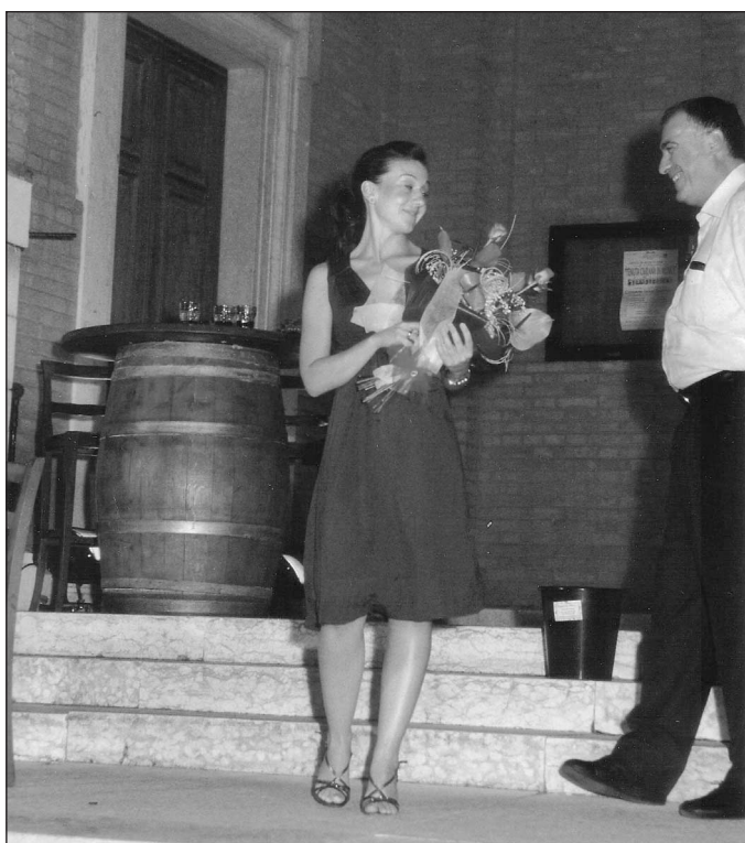
Cavarzere...in lirica Alcuni momenti della Cavalleria Rusticana presentata nell'ambito della manifestazione promossa dall'associazione Mistral