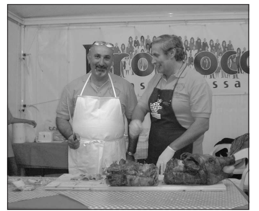
Bancarelle in centro Per la terza tappa di Gusto Polesine

dei loro nonni. Gli stand erano pieni di ogni prelibatezza, come la bondola offerta dallo stand di Ariano nel Polesine, la bruschetta all'aglio di Arquà Polesine, i bigul al torc di Canaro, lo gnocco dolce con cannella e zucchero di Canda, il risotto alla bosga di Corbola, la porchetta polesana di Castelmasse, le costine e polenta di Costa di Rovigo, le sarde in saor e gamberi fritti di Frassinelle Polesine, le trippe e la polenta infasolà con l'amaro Palladio fatto di tarassaco e altre erbe tipiche del nostro territorio di Fratta Polesine, il vino di Giacciano con Barruchella, i tortelli, la mostarda e gnocchetti al cuore di zucca di Melara, il salame da taglio di Taglio di Po e il salame con aglio