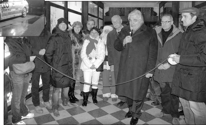
C'è chi taglia il nastro e chi taglia la corda Visto il freddo solo pochi temerari hanno resistito fino alla fine della serata

ADRIA Scenografie ridotte all'osso, la musica protagonista al Comunale