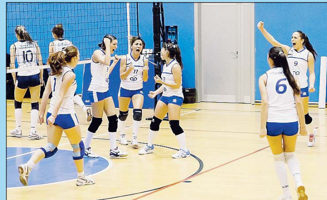
Iniezione di fiducia Per la Parente Fireworks

Era ovviamente importante per l'intero gruppo rialzare subito la testa ed ottenere il primo successo stagionale. Contento anche il mister Vicentini: "Sono contento della vittoria, dalla determinazione e dall'atteggiamento messo in campo. E' il primo