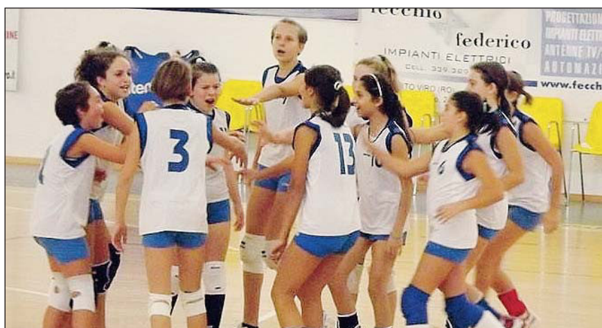
La carica iniziale Dell'Under 13 Ellepi

Ad ogni modo sono fiducioso che in futuro, potendo effettuare più allenamenti congiunti, ci siano buone possibilità di miglioramento nel corso del campionato".