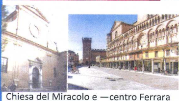
Chiesa del Miracolo e —centro Ferrara

OGGI 26 febbraio 2017: PELLEGRINAGGIO a FERRARA