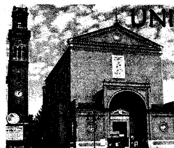
Cavarzere San Mauro

Ore 16,30 S. Messa presieduta dal Vescovo, Benedizione e premiazione dei bambini e “BRUSAVECIA”.