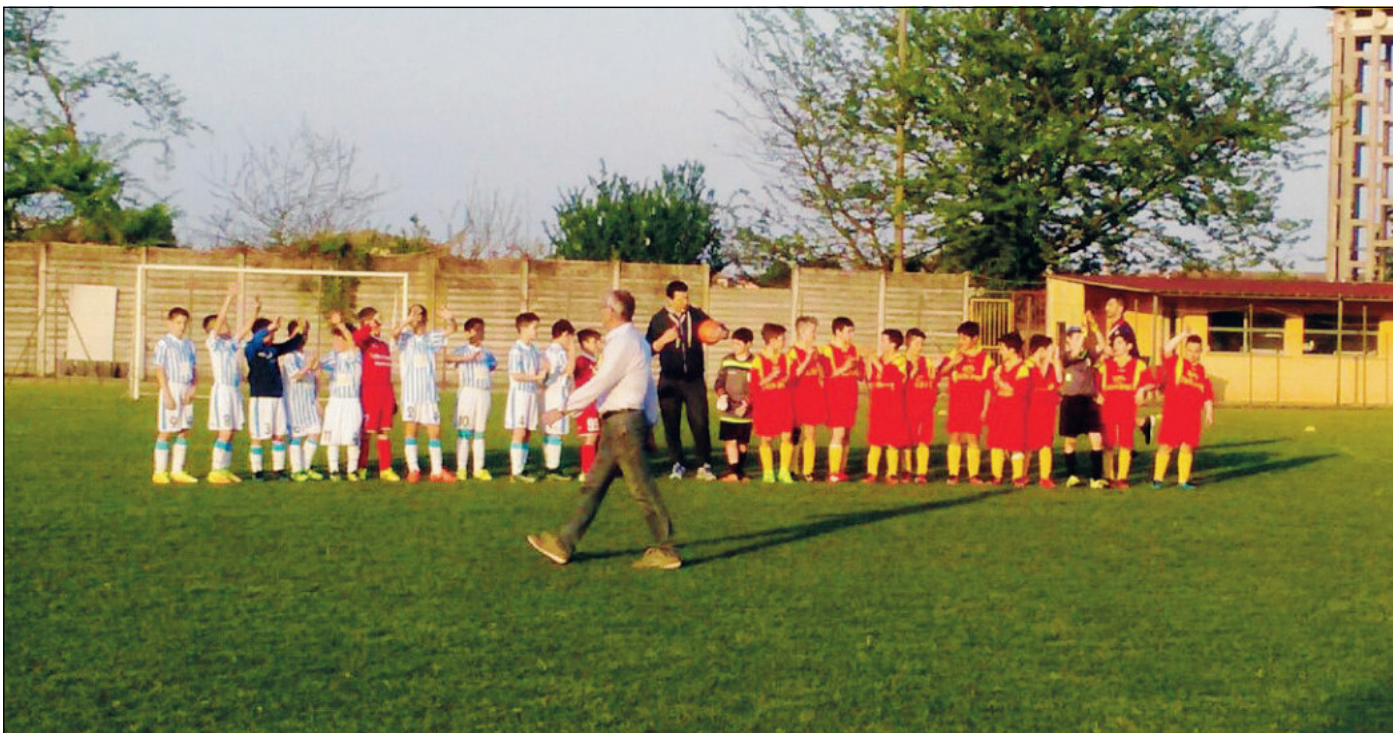
È stata una stagione calcistica ricca di eventi per il vivaio giallorosso (foto d'archivio)