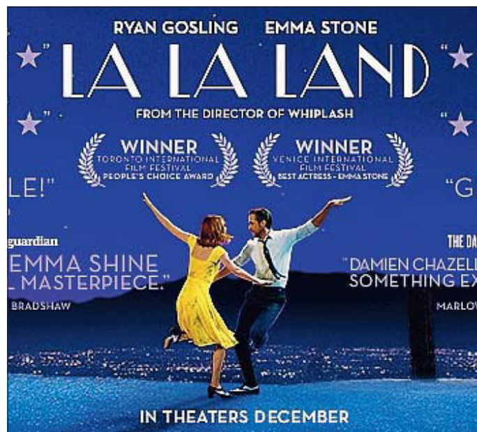
Al Politeama arriva "La la land"