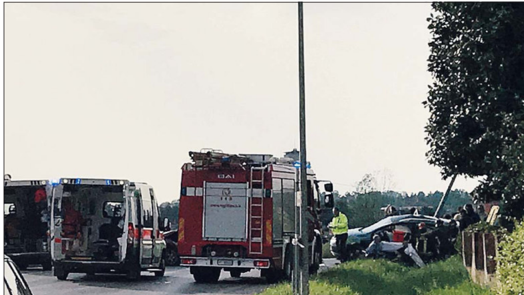
L'incidente del giorno di Pasqua sulla Cavarzere-Pettorazza

munque violentissimo, tanto che le due auto hanno riportato gravi danni.