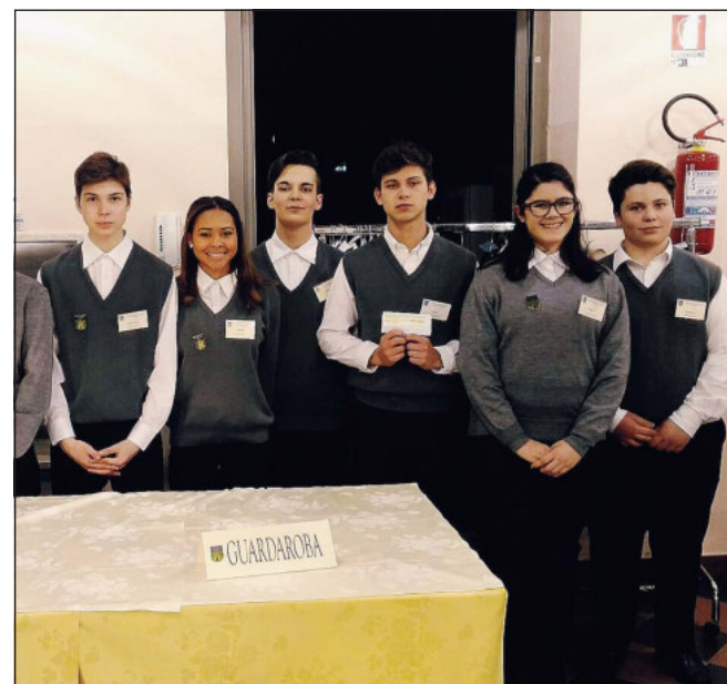
Alcuni studenti dell'Alberghiero