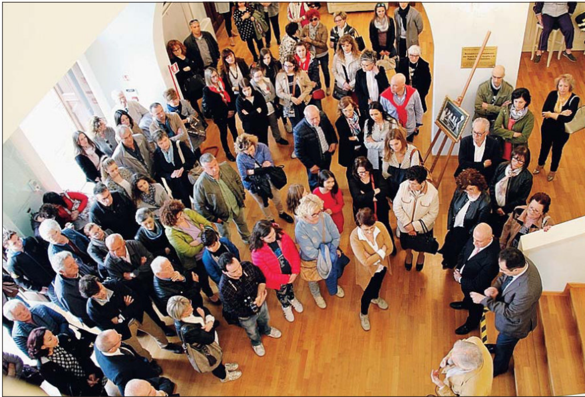
Settimana Serafiniana L'inaugurazione dell'evento che ha poi promosso il concorso "Una vetrina per il maestro"

Molti i commercianti che hanno aderito al concorso: Agenzia viaggi Soffio di mare, Artcornice, Bergo ferramenta, Cisalpina Tour, Creazioni floreali, Crema & cioccolato, Farmacia Menini, Foto Nora, Francesca fiori, Gioielleria Uno Valenza, Grigoletto ferra-