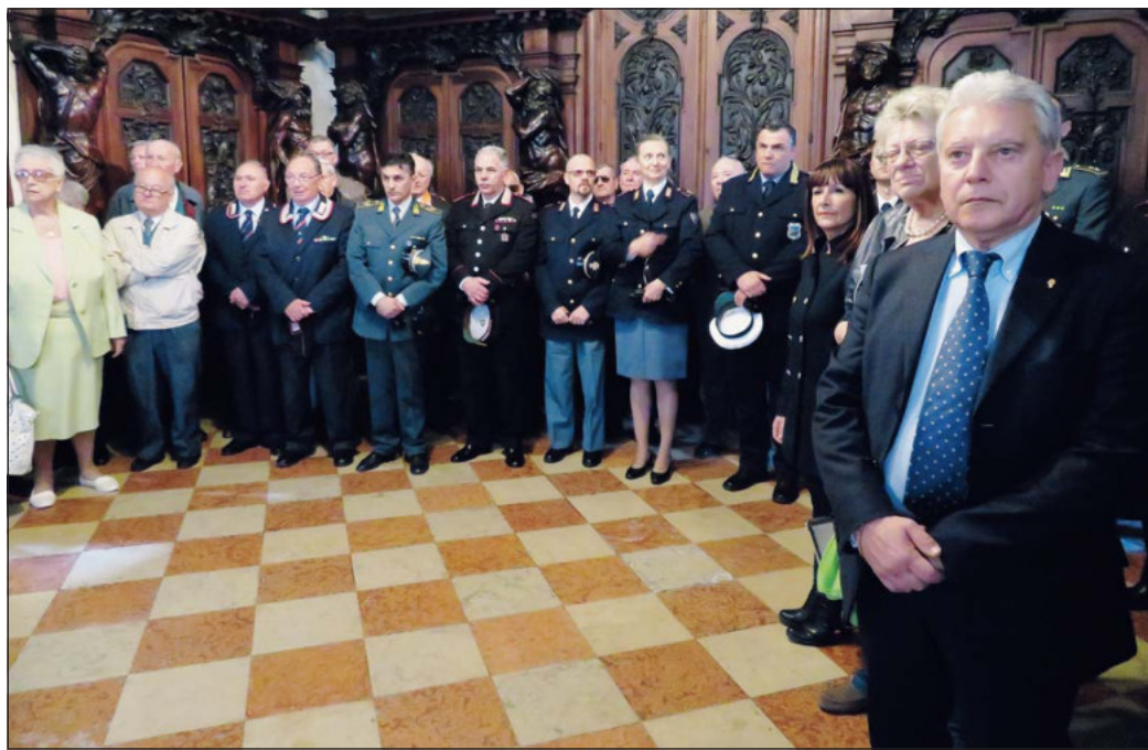
Il dono del cero pasquale Alcuni momenti della cerimonia nella Cattedrale