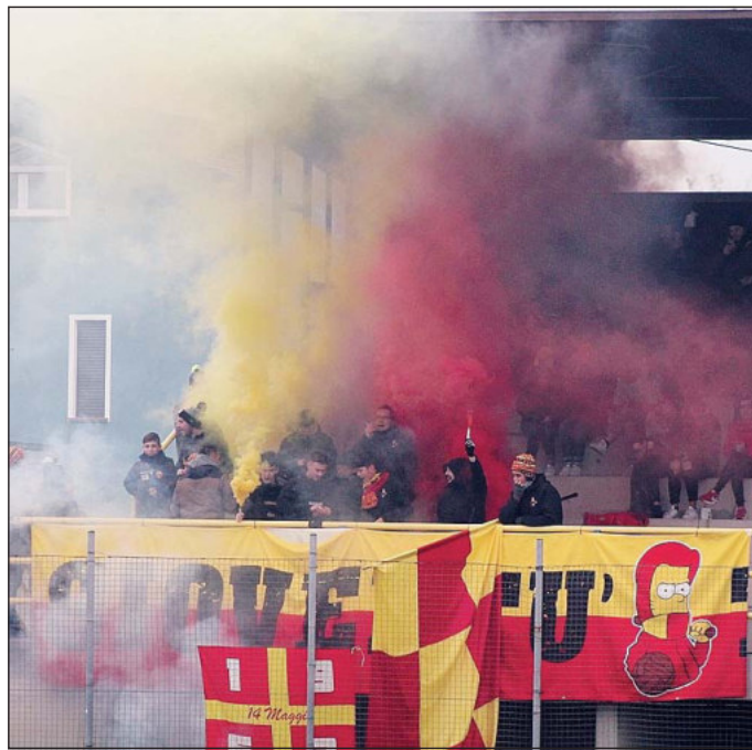
Solo gioie per i tifosi della Tagliolese

special modo sulle palle inattive e con i cross. Nel primo tempo abbiamo fatto fatica perché loro hanno giocato con ordine e non ci hanno permesso di trovare gli spazi, una volta sotto di un gol si sono un po' scomposti, come è giu-