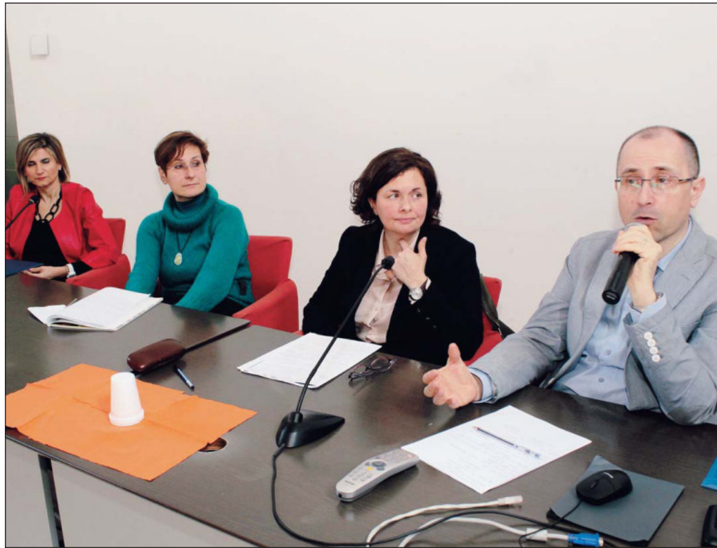
Relatori Gli esperti che hanno tenuto la relazione di fronte ai genitori degli studenti

L'evento ha coinvolto genitori, insegnanti e dirigenti scolastici. Molte le tematiche affrontate dai due relatori: dal rinnovato concetto di responsabilità, alla non sempre semplice definizione dei ruoli nel processo educativo; ciò ha permesso di sviluppare, durante i rispettivi interventi, le molteplici e articolate sfumature che hanno fornito all'uditorio significativi