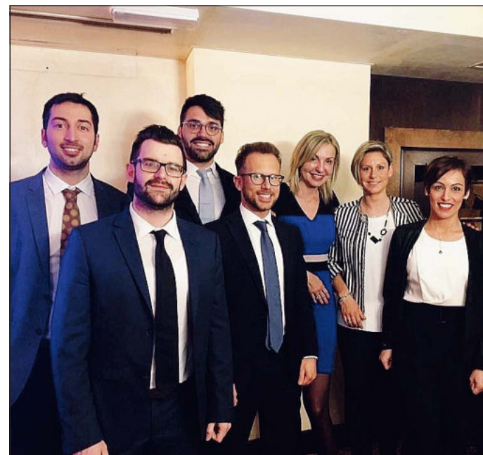
Il direttivo I ragazzi dell'Unione giovani dottori commercialisti