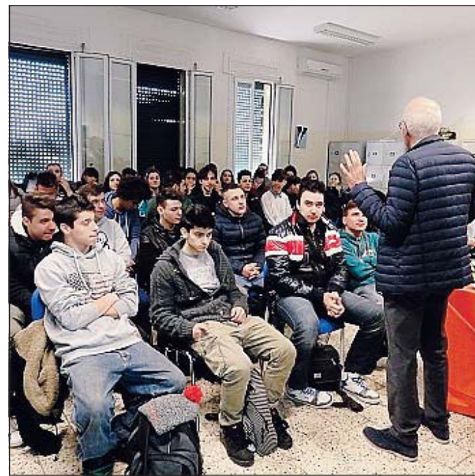
L'incontro all'Enaip con i Maestri del lavoro