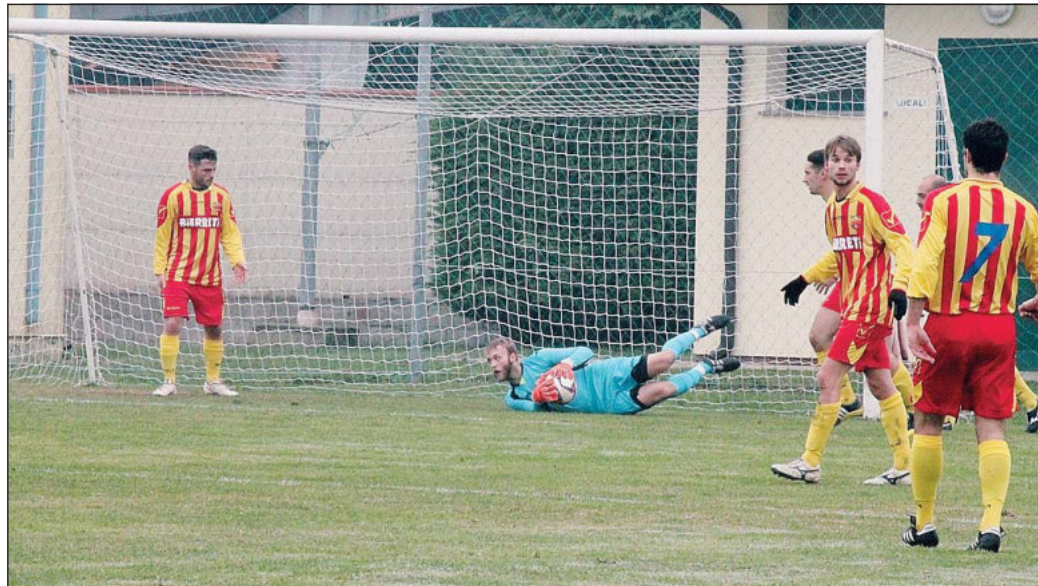
Colpaccio esterno della Tagliolese, il terzo posto non è un miraggio