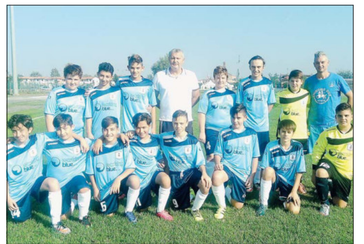
Il Cavarzere nella foto di gruppo

Poco consistente lo Junior Anguillara che resiste per circa una mezzora alla pressione dei padroni di casa e che solo in rare occasioni di ripartenze riesce ad arrivare dalle parti di Zenaro, sempre ben protetto dall'invalidabile Bertaggio. Il giocatore domina la