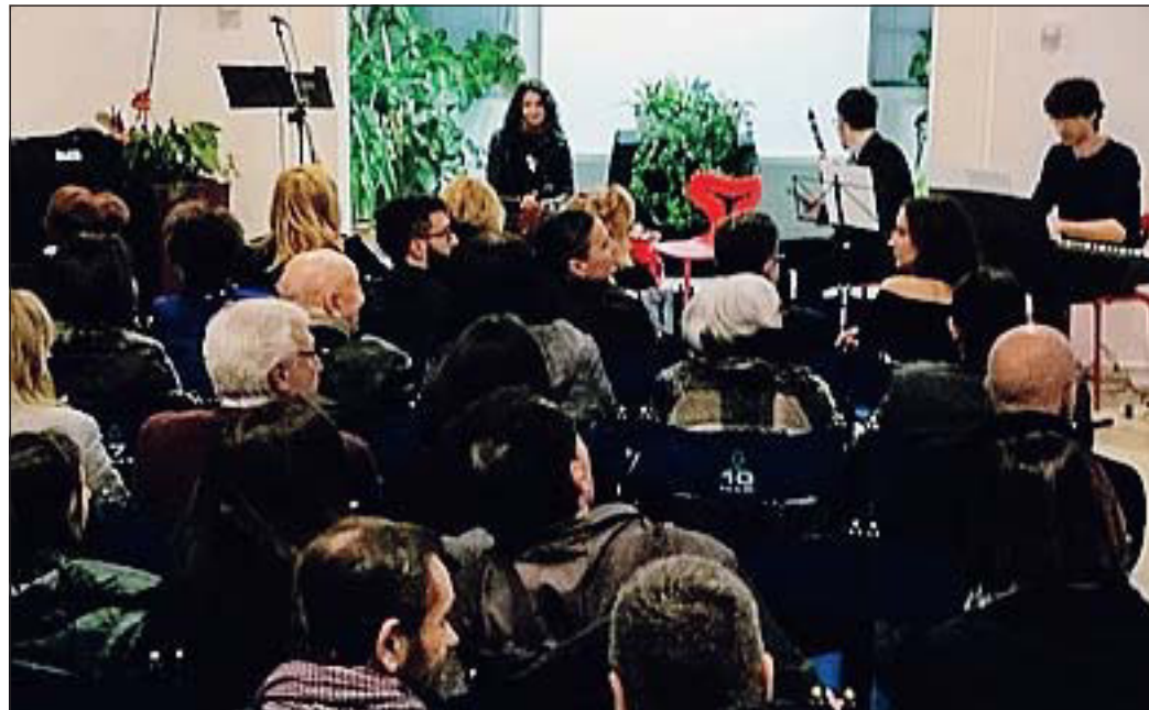
Alcune immagini dell'Aperitivo letterario tenutosi sabato scorso in Biblioteca a Porto Viro