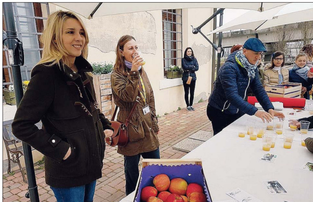
Il momento della merendina naturale