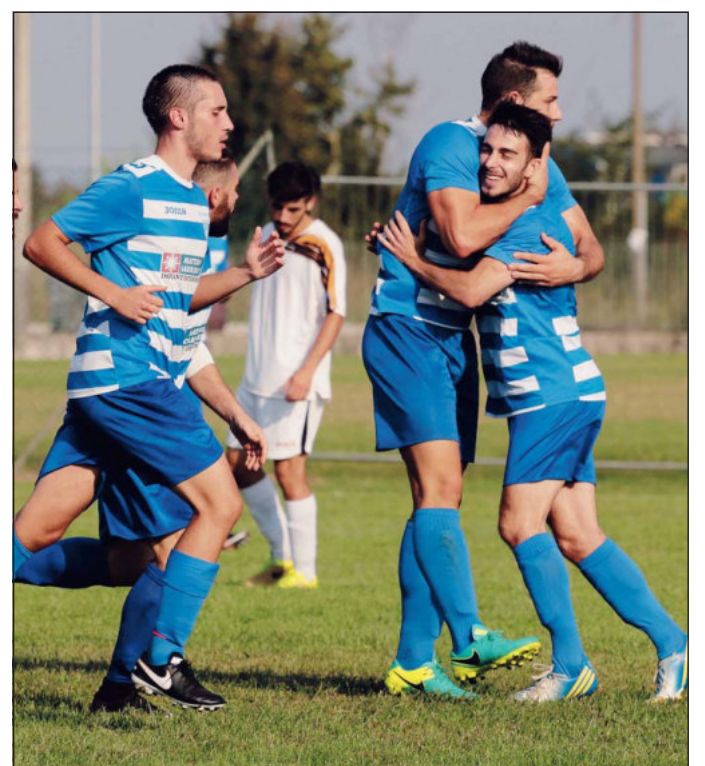
I biancazzurri guadagnano un punto fondamentale