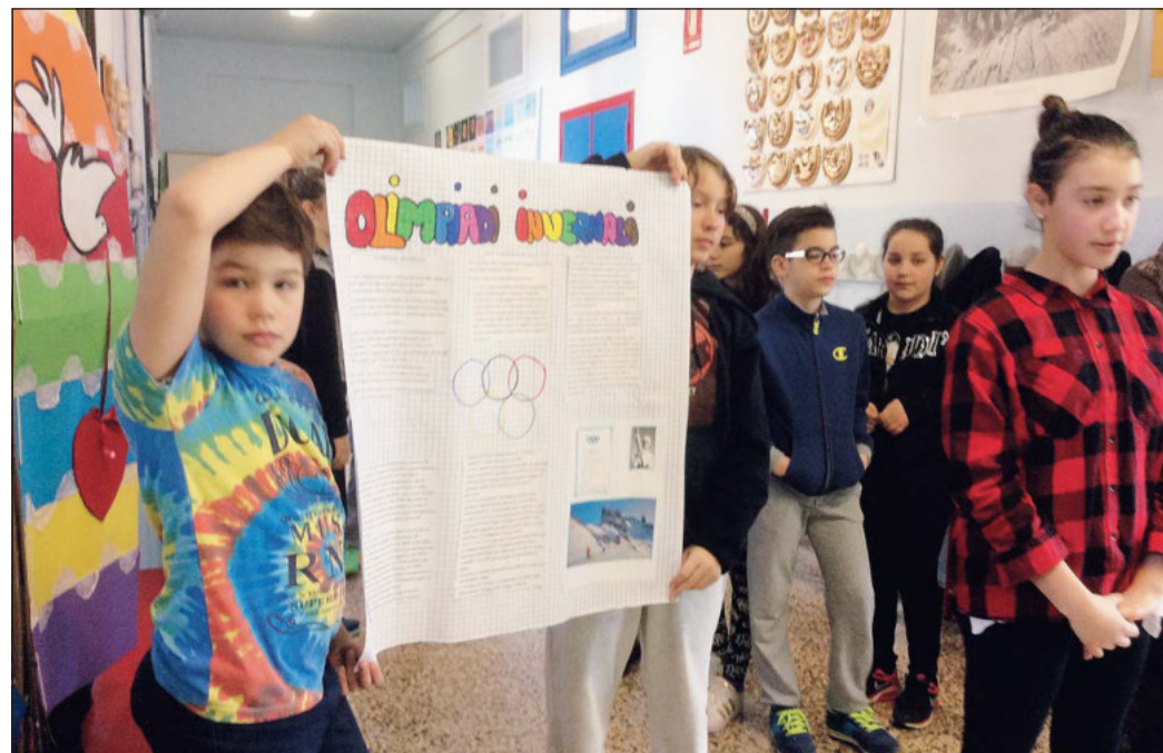
Alcuni momenti della full immersion nello sport del Comprensivo di Adria