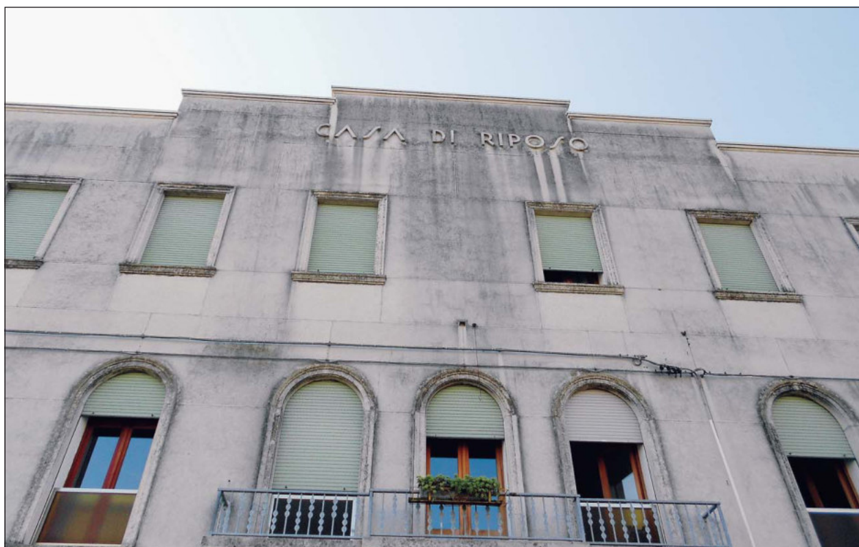
La storica facciata della casa di riposo, in riviera Sant'Andrea

Tuttavia questa presa di posizione fa emergere un dato politico di grande rilevanza: la richiesta di "sfratto" per Passadore&C arriva dal partito del governatore Zaia ed è facile immaginare che Zennaro abbia avuto qualche contatto con Venezia, come è avvenuto di recente in occasione della manifestazione per l'ospedale. A tutto questo si aggiunge l'iniziativa annunciata ieri dall'indipendentista Luca Azzano Cantarutti il quale ha fatto sapere che presenterà in Regione la richiesta di commissaria-