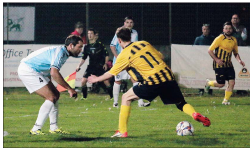
Adige Cavarzere impegnato oggi pomeriggio tra le mura amiche

realizzate da Gibbin e Travaglia). A dirigere il match di oggi pomeriggio il direttore di gara Martino Chiarion della sezione di Rovigo. La gara dell'andata terminò con un secco 2-0 a favore della formazione cavarzerana. Oggi pomeriggio, quindi, il Buso cercherà di dimenticare anche la sconfitta subita all'andata. La sfida odierna sarà solo un piccolo "antipasto" dell'ottava di ritorno, che andrà in scena domani pomeriggio. Ecco le