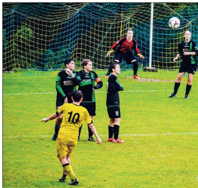
Il Gordige attende il Virtus Padova

SERIE B FEMMINILE Servono altri punti in chiave salvezza