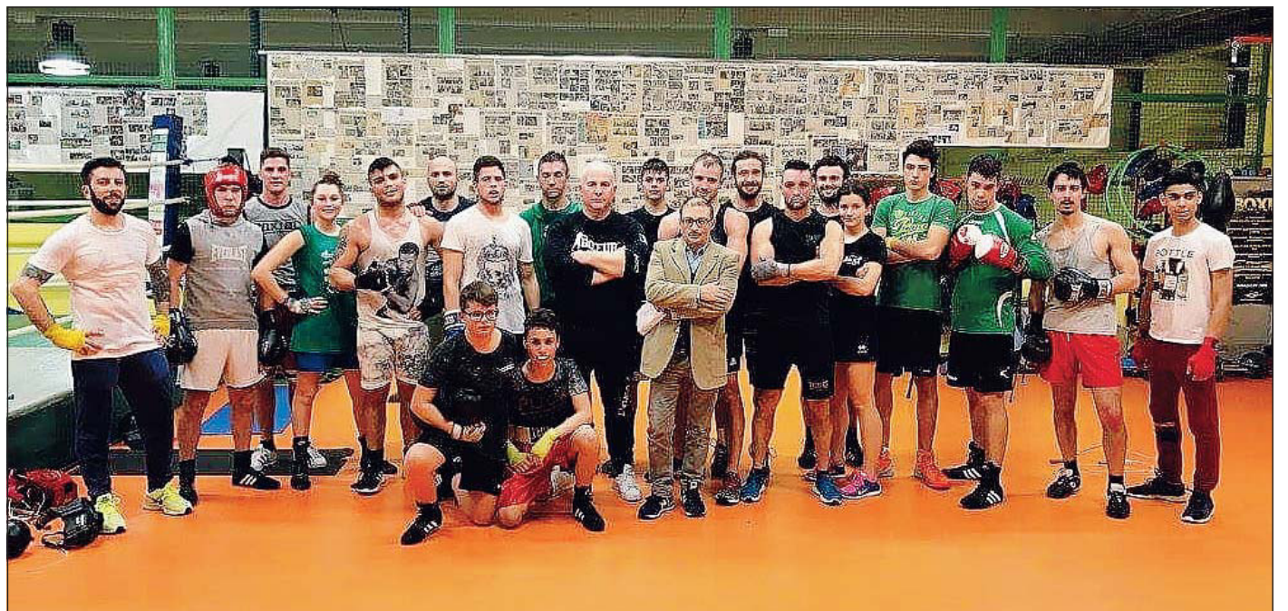
Foto di gruppo degli atleti della Boxe Cavarzere dopo la registrazione del programma in onda su Prima Free