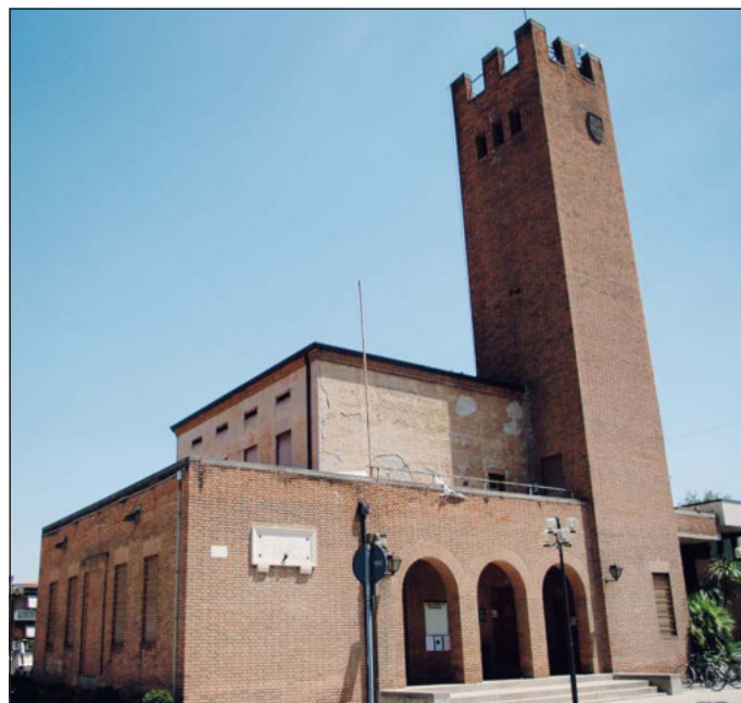
Il concorso al via Organizzato da comune e biblioteca di Solesino