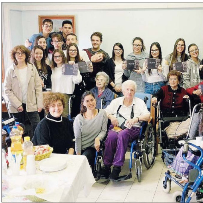
Gli studenti tra gli anziani

Così l'iniziativa è stata inserita nel programma di alternanza scuola/lavoro dello scientifico "Bocchi-Galilei" ed ha permesso, attraverso colloqui fra ragazzi e nonni, di valorizzare il legame tra la generazione degli adolescenti di oggi e quelli di ieri, mettendo in relazione diversità, cambiamenti e somiglianze al fine di sensibilizzarli reciprocamente.