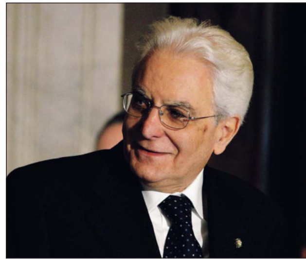
Il presidente della Repubblica Sergio Mattarella

PEGOLOTTE (Cona) - Le due classi della quinta elementare di Pegolotte di Cona, nel Cavarzerano, accompagnate dalle rispettive insegnanti, ieri, intorno a mezzogiorno, sono state ricevute in udienza al Quirinale dal presidente della Repubblica Sergio Mattarella, il quale ha voluto così accogliere il desiderio espressogli in una letterina inviatagli tempo fa della due scolaresche conensi.