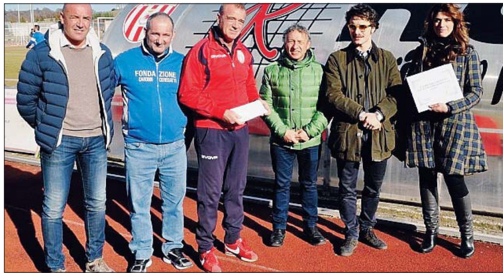
I protagonisti della giornata di solidarietà