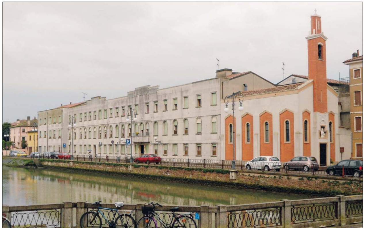
La Casa di riposo di riviera Sant'Andrea

I sindacati ricordano che "dopo pochi giorni dal suo insediamento abbiamo ricevuto decine di chiamate dai lavoratori fortemente preoccupati, ci hanno chiesto un'assemblea urgente dove la numerosissima partecipazione ha evidenziato la grave situazione determinata dalle prime decisioni assunte unilateralmente dal direttore modificando orario di lavoro ed impedendo l'utilizzo di strumenti di flessibilità quali il 'cambio turno' che, per persone che lavorano in strutture aperte 24 al giorno per 365 giorni l'anno, permette di gestire anche la vita privata e la propria famiglia senza assolutamente incidere sull'organizzazione di lavoro e sul servizio erogato".