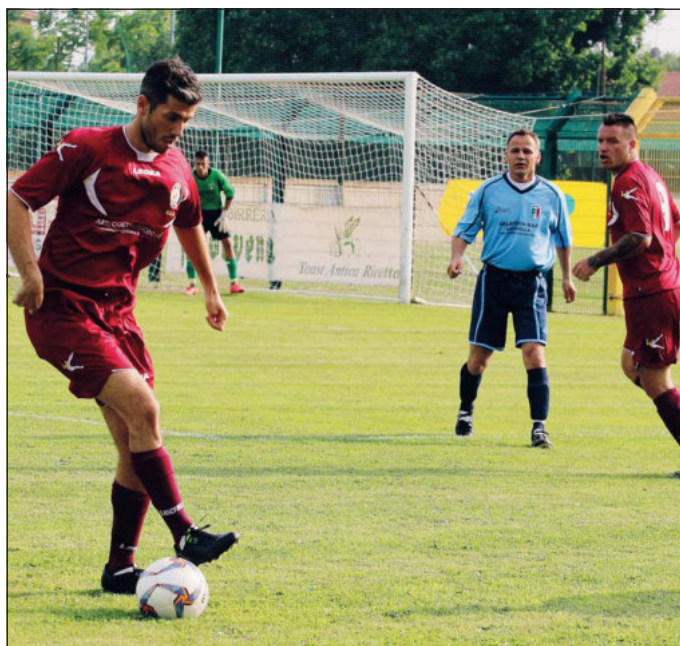
Fioccano le squalifiche negli amatori Uisp (foto d'archivio)