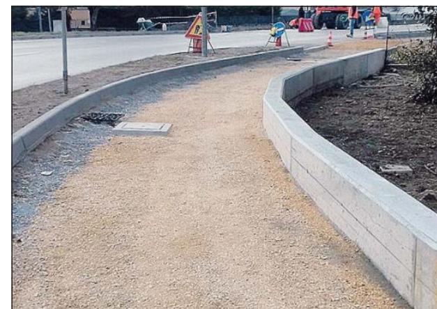
I lavori per la ciclabile in viale Regina Margherita