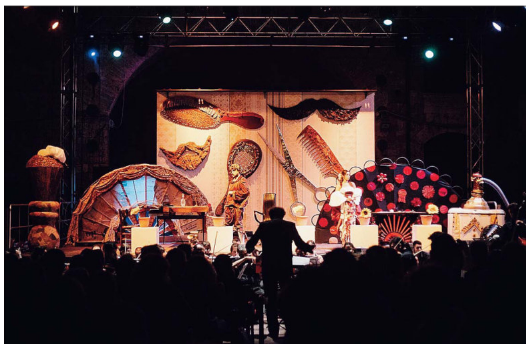
Nelle foto, suggestivi costumi e scenografie realizzate dal riciclo dei rifiuti