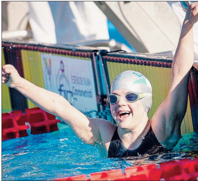
L'atleta di Canaro esulta in vasca dopo un successo

25, 50, 100 e 200; nel dorso i 25, 50, 100 e 200; nella farfalla i 25, 50, 100 e 200; i 100 e 200 misti e le staffette 4x25 stile libero settore promozionale e 4x50 stile libero settore agonistico gli atleti appartengono