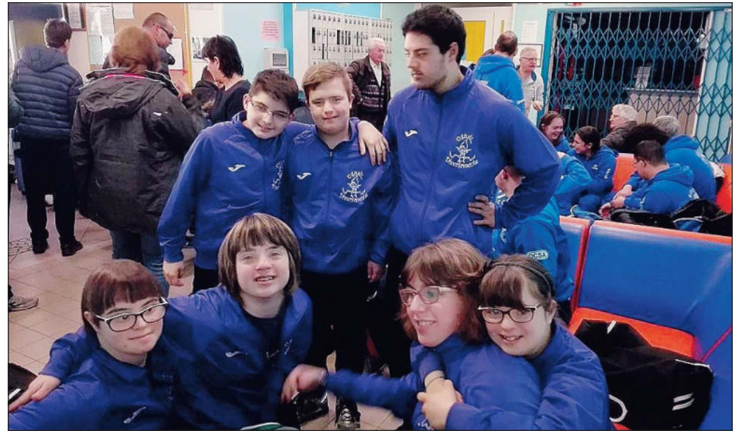
Uguali... Diversamente, un gruppo unito ed affiatato

alle classi S14 e C21. La squadra della Uguali... Diversamente sarà al gran completo per l'apertura della stagione agonistica Fisdir. Tutti questi campioni sperano di salire in zona podio e si tratta di Sara