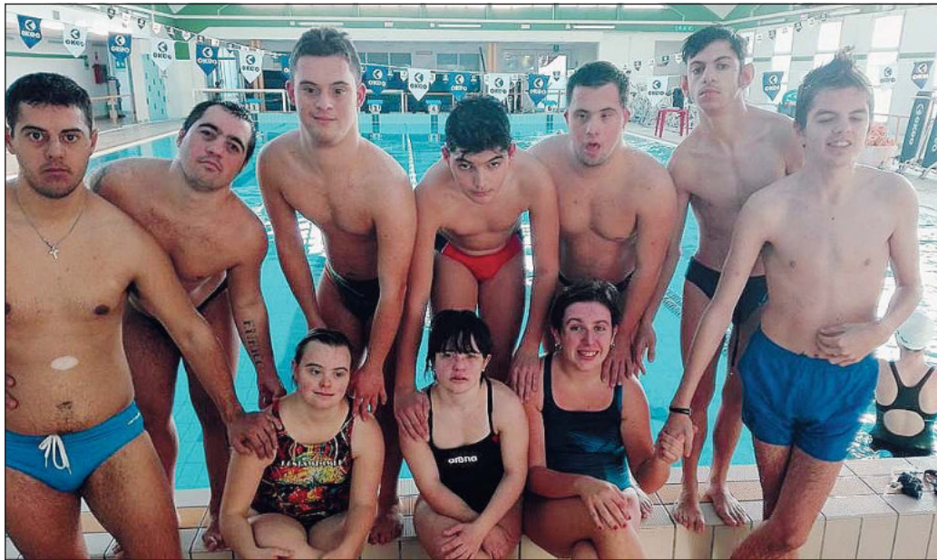
I campioni di Uguali... Diversamente, protagonisti anche nella stagione in corso

Le gare saranno nello stile libero i 25, 50, 100, 200 e 400; nella rana i