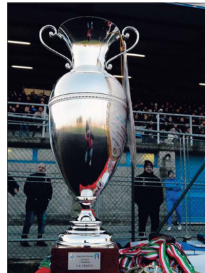
Chi alzerà al cielo di Rosà la Coppa Italia Dilettanti? Si sfideranno Ambrosiana e Clodiense

Nel giorno dell'Epifania, allo stadio comunale di Rosà (Vicenza) l'attesissima finale della fase regionale della Coppa Italia dilettanti. Si sfideranno gli scaligeri dell'Ambrosiana e i veneziani della Clodiense, già rivali nel girone A del campionato di Eccellenza (Ambrosiana prima, Clodiense seconda ad un punto di distanza). Fischio d'inizio alle 14.30. E' prevista sugli spalti una notevole affluenza di pubblico. Sempre il 6 gennaio, a partire