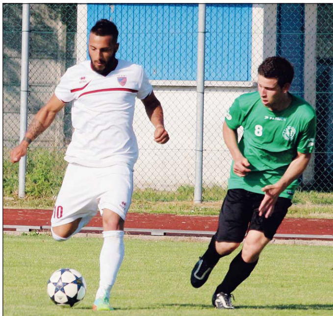
L'Adriese sta programmando la nuova stagione