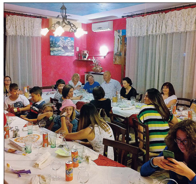
Un momento dell'allegria pizzata