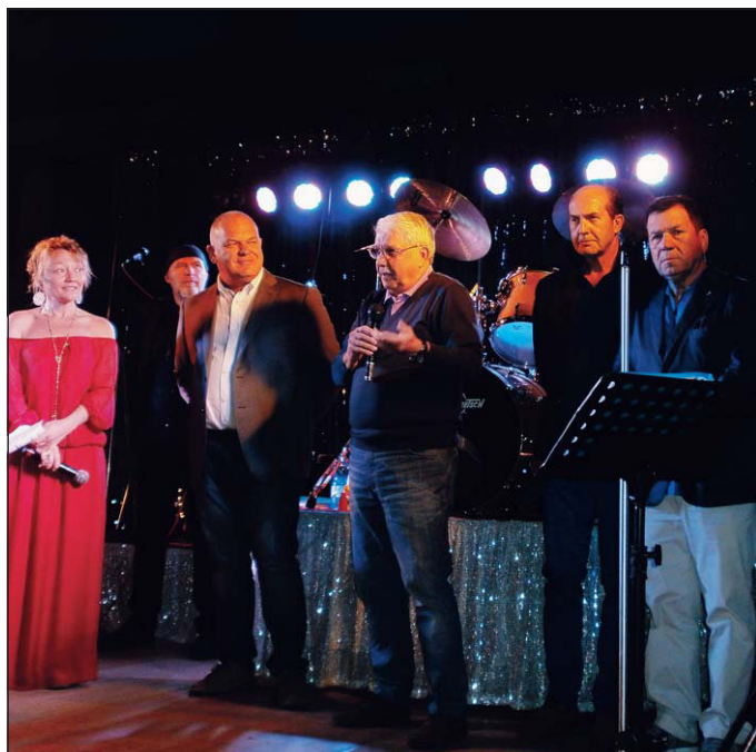
Un'immagine relativa all'evento culturale