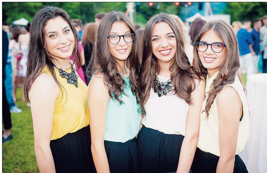
Le liceali alla festa di fine anno sul modello statunitense