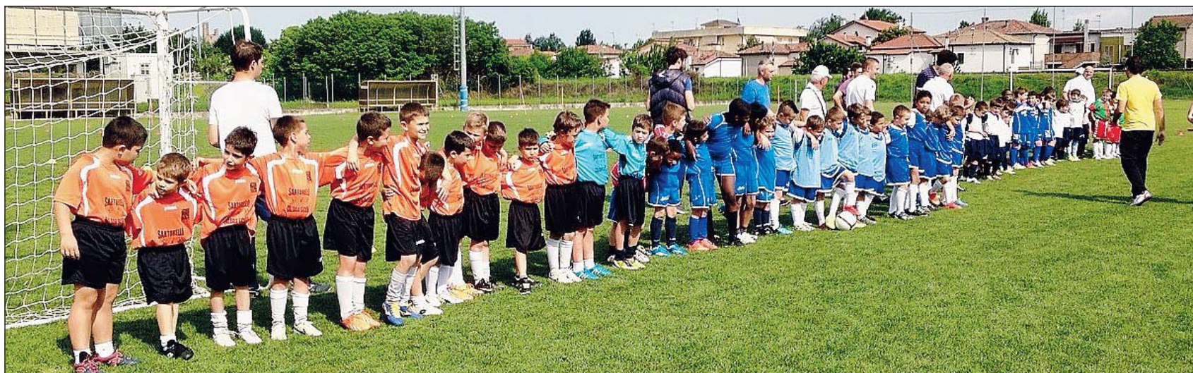
Il trofeo "Primavera" promosso dalla Polisportiva San Pio