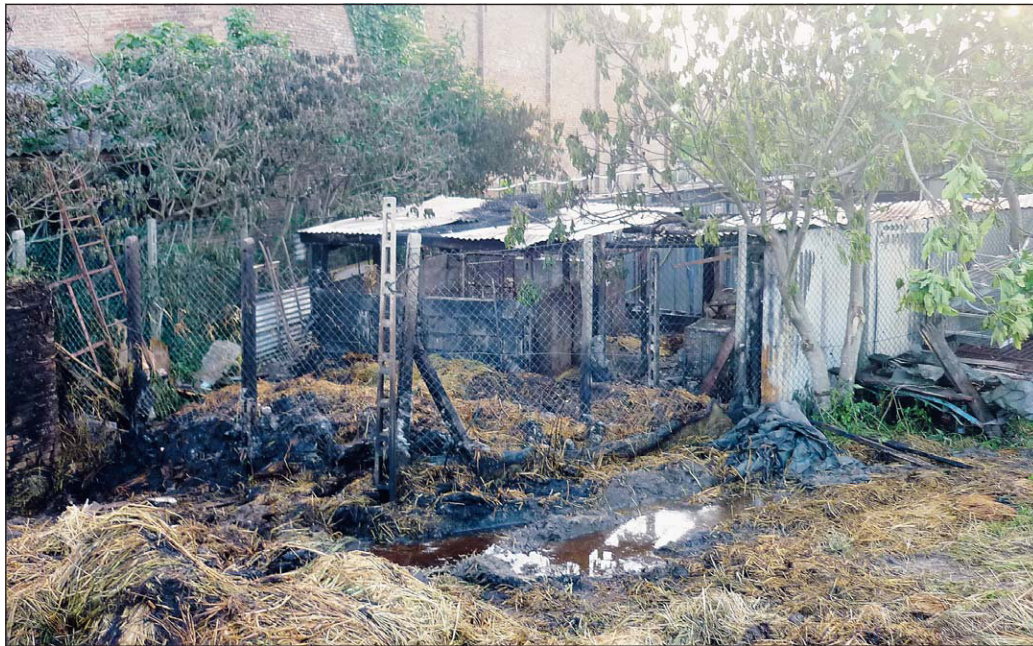
Momenti di paura Nelle foto, il luogo dell'incendio e la capre salvate

I vigili del fuoco, allertati intorno alle 17, hanno dovuto lavorare per ore prima di portare la situazione alla normalità. La struttura della stalla