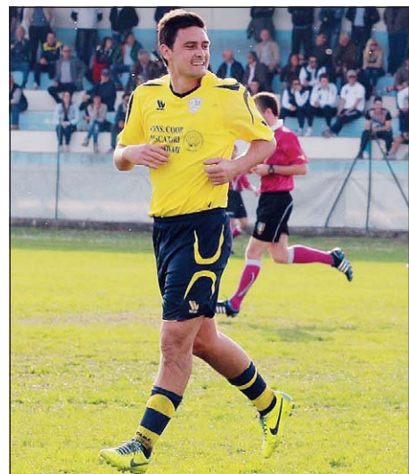
I Pescatori passano il turno