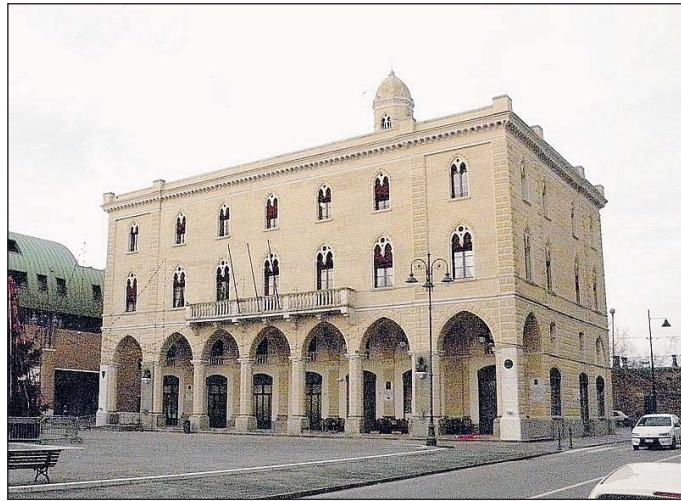
Cavarzere ospiterà il tradizionale "Memorial Michele Sella"

Quattro le maglie tricolori in palio per ciascuna delle quattro categorie in gara che serviranno a premiare i migliori team in gara. Tre i tracciati che sono già stati disegnati dagli uomini del Veloce Club Gabriele Sella e approvati dalla Federazione ciclistica italiana: uno di 16 chilometri riservato alle donne Allieve, uno di 26 chilometri che dovrà essere affrontato da Allievi e donne juniores e, infine, quello di