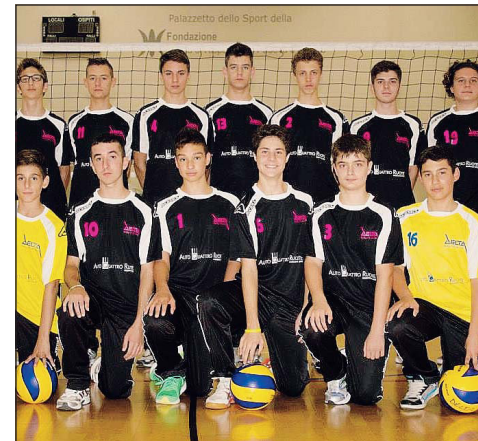
l'Under 17 dell'Alva Inox