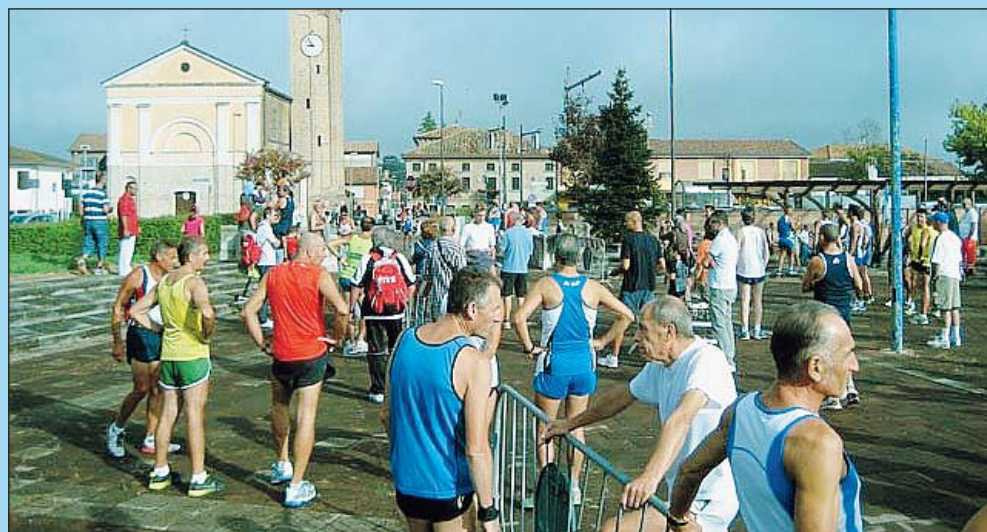
Domenica a Baricetta l'edizione "Ti pedala... che mi a coro"