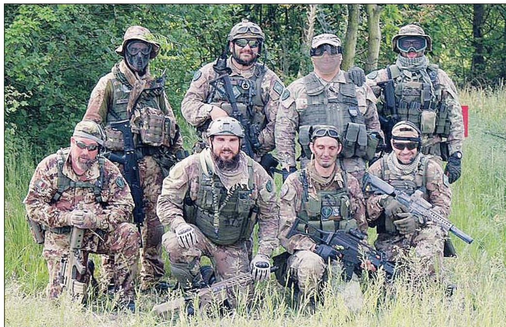
Alcune immagini della terza tappa che si è tenuta a Trecenta