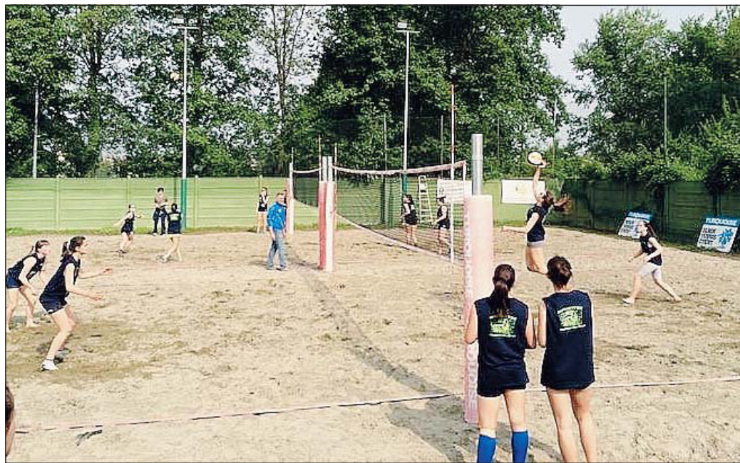
Una fase di gioco all'Insand Cup (foto d'archivio)

ROVIGO - Insand Cup, arriva la seconda tappa. Saranno 11 le società rappresentate, con oltre 70 atleti tra ragazze e ragazzi Under 16, 18 e 20 in campo nel weekend al Circolo tennis Rovigo. Sarà questa l'ultima occasione per cercare di classificarsi al meglio e incamerare punti per l'accesso al master finale, previsto domenica 7 giugno a Villaggio Barricata, all'interno della oramai storica manifestazione Mininbeach sempre 'targata' Fipav Rovigo. A iscrizioni chiuse, a caccia delle vittorie in questa seconda tappa, sono ben 11 le società che con le proprie coppie nelle varie categorie si daranno battaglia. Per Gsd Tor Castelmasa, Us Virtus, Adria volley, Polisportiva San Bortolo, Ellepì San Giusto, Polisportiva San Pio, Bvs, Asaf, Beng Rovigo, Volley Ariano e Tumbo volley. "Ci sono coppie che in questi 15 giorni si sono allenate un paio di volte la settimana per cercare la vittoria di tappa, direi che non c'è altro da aggiungere - afferma soddi-