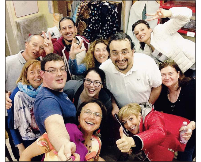
Il selfie della compagnia Instabile Tagliolese

MAZZORONO SINISTRO - Il parco dell'ex ostello di Mazzorono Sinistro ospita questa sera alle 21.15 la prima tappa della carovana del "Teatro in giro", rassegna di teatro amatoriale promossa dalla Pro loco adriese. Protagonista sul palco la Compagnia instabile tagliolese con la commedia in due atti "Si... viaggiare" di Marco Ferro. In un'agenzia di viaggi entra Cicci Bo, desideroso di acquistare una bella e rilassante vacanza, ma tra incomprensioni e fraintendimenti tra cliente e operatore turistico non si sa se riuscirà a partire. La Compagnia è nata nel 2005 per volontà di un gruppo di persone accomunate dalla passione sincera per il teatro amatoriale e la commedia dialettale, quindi non ci sono attori professionisti, ma simpatici personaggi che dimostrano sulla scena doti artistiche ed organizzative non comuni.