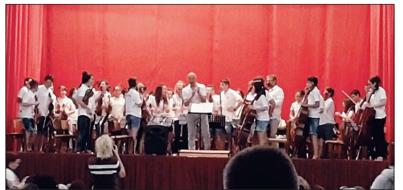
Un momento del saggio della II e III F della Cappon

interpretazione di "Gabriel's Oboe" di Morricone, "Ave Maria" di Piazzolla e del celebre Adagio di Alessandro Marcello. Hanno concluso il concerto gli allievi della seconda e terza F, con alcuni ex alunni, eseguendo tutti insieme brani particolarmente impegnativi. Molto apprezzata dal pubblico l'esecuzione di "We are the champions" dei Queen, della quale è stato concesso il bis. A fine concerto agli insegnanti del corso a indirizzo musicale e