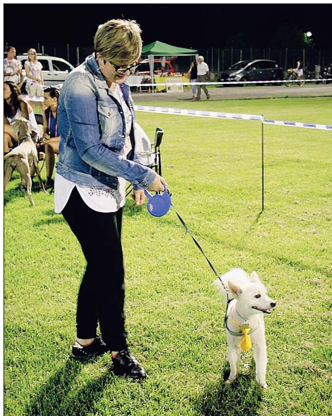
Alcune immagini della splendida serata dedicata ai quattro zampe negli impianti sportivi di via Spalato, la 25esima edizione della mostra cinofila