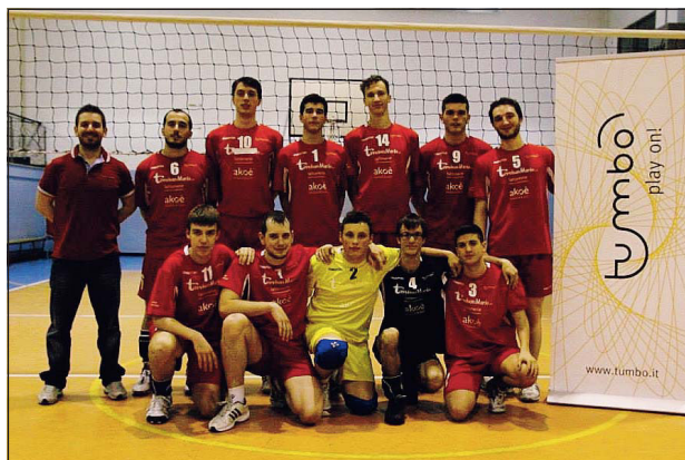
Stagione più che positiva Ottimo terzo posto per la compagine rodigina che adesso spera nel ripescaggio in Seconda