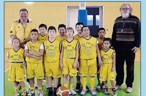
Talenti badiesi Gli Aquilotti

BADIA POLESINE - Nuovi appuntamenti con il basket badiese. Minibasket Aquilotti Oggi i classe 2002, 2003, 2004, 2005 affrontano in casa il San Martino. Si disputeranno sei tempi regolamentari, oltre tre per i più piccoli. Domenica 26 festa regionale a Maser, parteciperanno le migliori 54 squadre del Veneto. Alle 14.30 inizieranno le gare, alle 16.30 le premiazioni. Ogni formazione sarà formata da massimo cinque mini atleti. Saranno allestiti sei campi, uno per ogni girone di nove squadre, che si affronteranno in un calendario completo di otto gare. Domenica 2 giugno ci sarà il Trofeo Zerbetto a Montagnana, torneo riservato ai classe 2003-2004. I 2005-2006 il 2 giugno saranno impegnati a Bagnolo di Po nel terzo trofeo del presidente. Tutte le giovanili saranno presenti sabato 8 tutti allo "Sport in piazza" a Rovigo in piazza Vittorio Emanuele II. La Fip