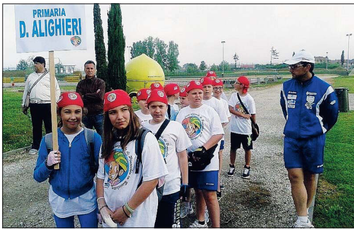
Ancora sul tetto d'Italia I Lions D Cavarzere e la primaria Alighieri

Grande soddisfazione per i quattordici giovani al "Pinocchio in bicicletta"