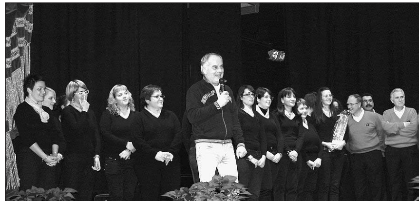
Alcune immagini della serata