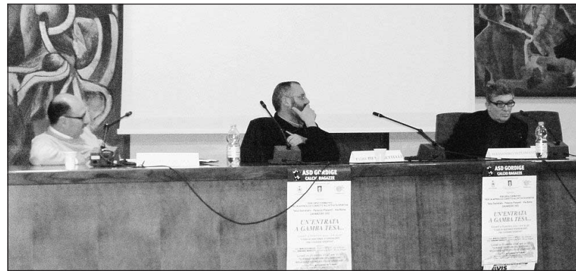
I relatori della serata

Rispondendo alle domande del pubblico attento, Tettamanzi ha sostenuto che va bene il genitore dirigente, ma se fatto entrare in punta di piedi, con ruoli definiti e non sovrapposti alle altre figure della società, e possibilmente slegato alla cura della squadra del figlio.