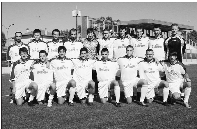
La squadra del Cavarzere; dietro, la nuova tribuna del Di Rorai