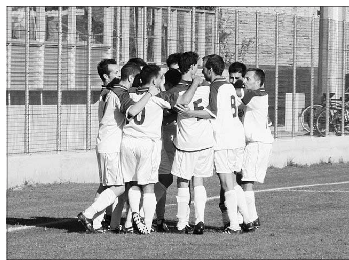
Gioia biancazzurra Per i neopromossi cavarzerani un grande successo